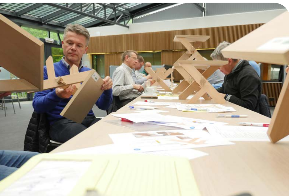
Geen detail ontsnapt aan het kenner-soog van de vakjury.