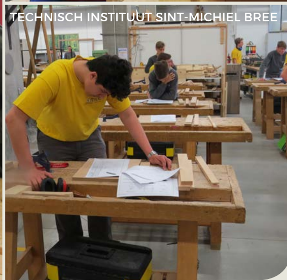
TECHNISCH INSTITUUT SINT-MICHEL BREE

In 61 Vlaamse Scholen was donderdag 25 april geen schooldag als alle andere. De 840 deelnemers aan de Vlaamse Houtproef kregen die dag immers geen les. In plaats daarvan moesten ze tijdens de schooluren een tafeltje in elkaar timmeren met veel oog voor detail en een secure afwerking. Een sfeerbeeld.