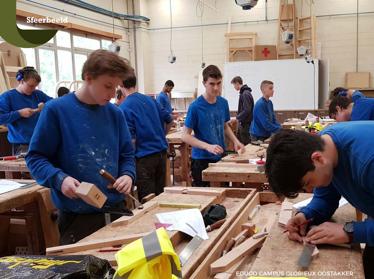
EDUGO CAMPUS GLORIEUX OOSTAKKER