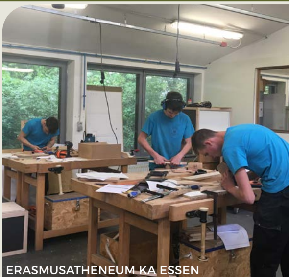
ERASMUSATHENEUM KA ESSEN