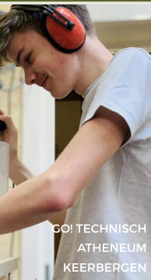
GO! TECHNISCH ATHENEUM KEERBERGEN

In 61 Vlaamse Scholen was donderdag 25 april geen schooldag als alle andere. De 840 deelnemers aan de Vlaamse Houtproef kregen die dag immers geen les. In plaats daarvan moesten ze tijdens de schooluren een tafeltje in elkaar timmeren met veel oog voor detail en een secure afwerking. Een sfeerbeeld.