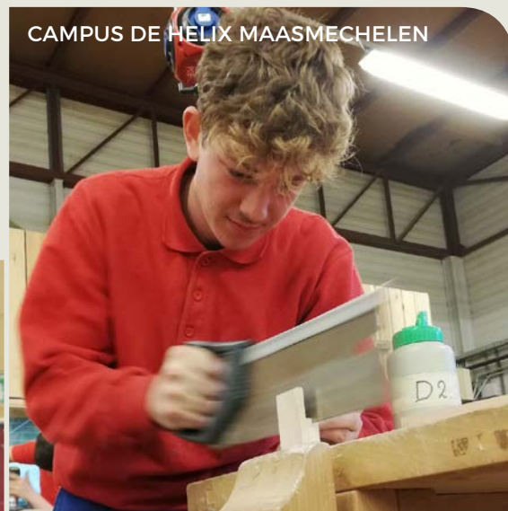
CAMPUS DE HELIX MAASMECHELEN