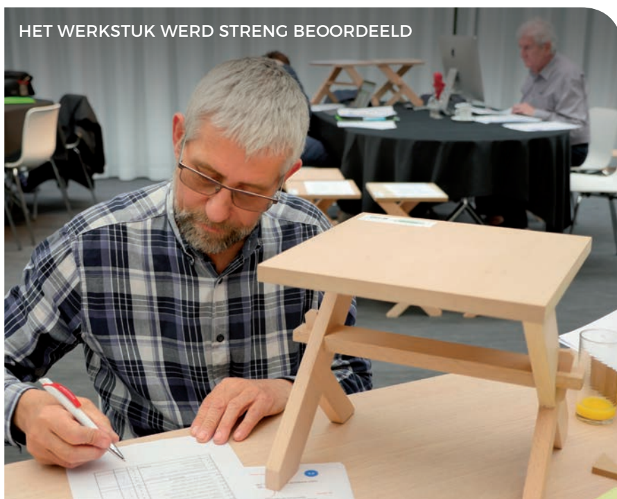
HET WERKSTUK WERD STRENG BEOORDEELD

Het hout en de andere materialen die nodig waren voor het werkstuk, werden gratis geleverd door de sponsors van het event. De steun van die sponsors is cruciaal, zo kunnen we ervoor zorgen dat de scholen geen financiële inspanning moeten leveren, waardoor de wedstrijd voor alle geïnteresseerde scholen laagdrempelig en toegankelijk blijft.