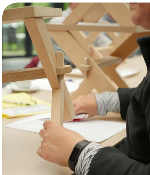
Elk onderdeel kreeg een quotering.